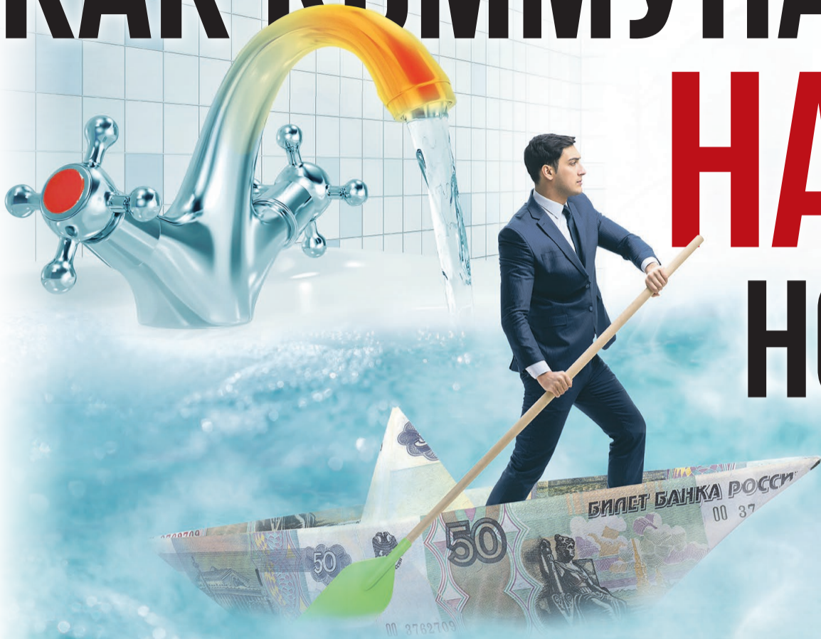
Фото: 123rf.com, иллюстрация разработано Freerik, коллаж Елена Пантелеева

Депутат Партии СПРАВЕДЛИВАЯ РОССИЯ – ЗА ПРАВДУ вывел коммунальщиков на чистую воду. Горячую.