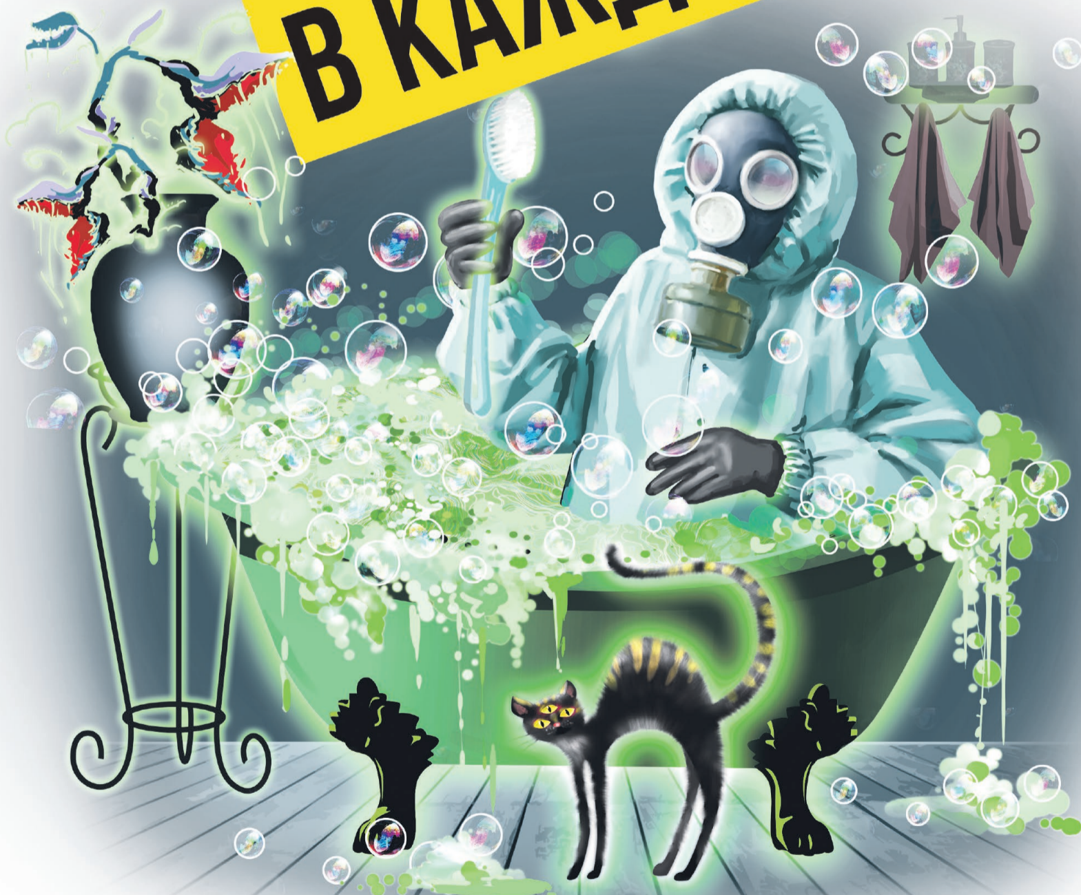
Иллюстрация: Наталья Халай

Во Владимире хотят возвести жилые дома на том самом месте, где ещё в советские времена были захоронены крайне опасные отходы. Стройка начнётся, будут вырыты котлованы и радиоактивный газ радон может оказаться на свободе. Как владимирские социалисты пытаются предотвратить экологическую катастрофу,