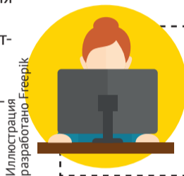
Иллюстрация разработано Freerik

Но всё это – лишь капля в море коммунальных проблем, которые захлестнули население области. Например, жители дома №19, в 3 квартале Радужного, жалуются на систематическое отсутствие напора холодной воды.